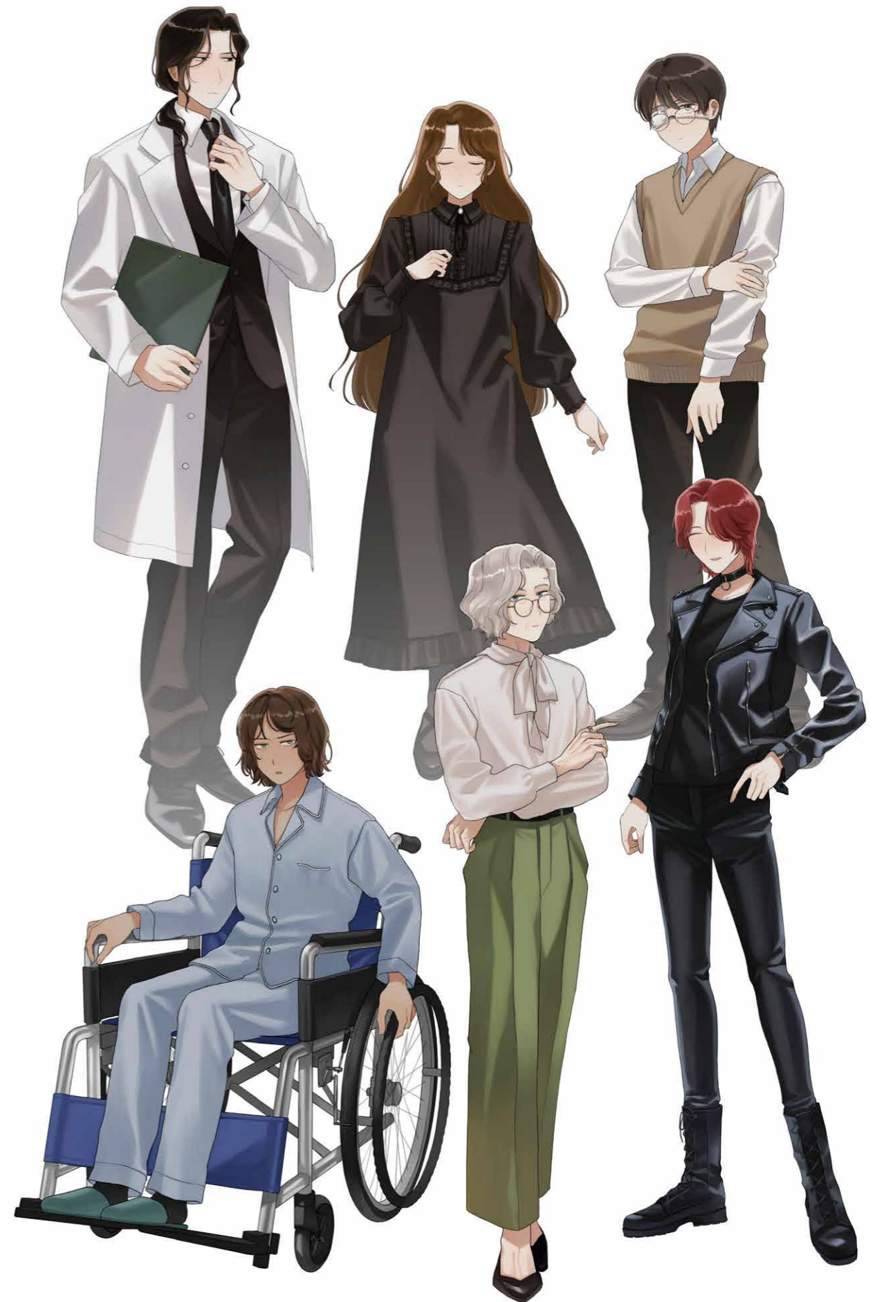
販売用オリジナルイラスト ゲームなどに使用できるキャラクター素材 (2025年制作)