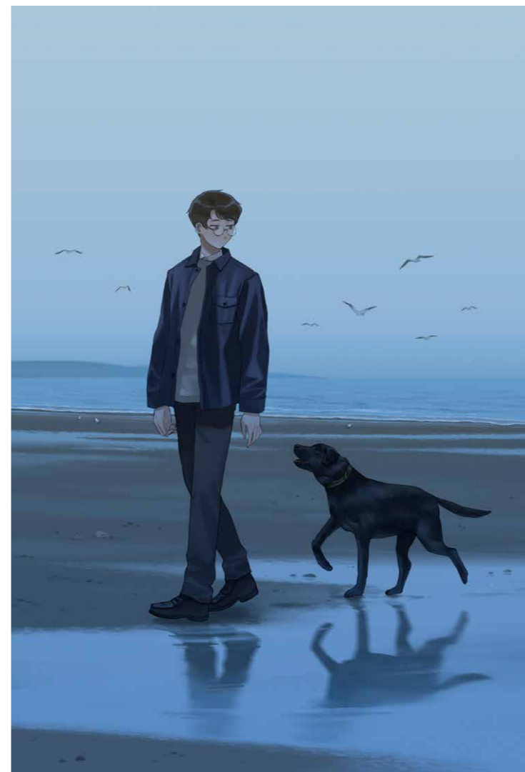
右頁 オリジナルイラスト イギリス旅行で見た風景を元に描いたシリーズ (2024年制作)