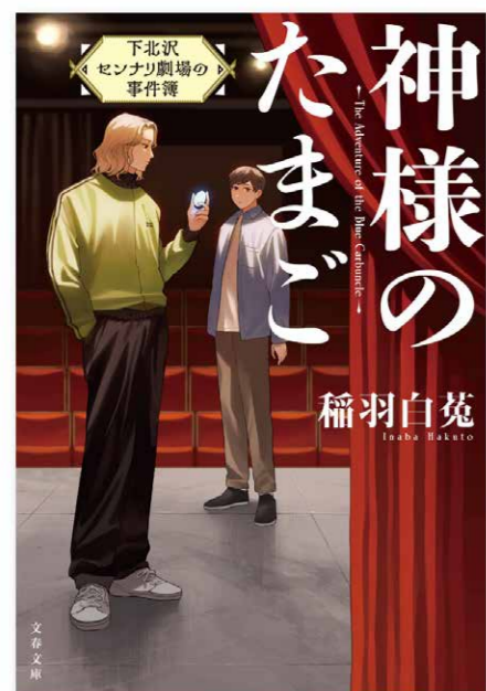
『神様のたまご 下北沢センナリ劇場の事件簿』 (文藝春秋) 装画 著者：稲羽白菟 装幀：征矢武