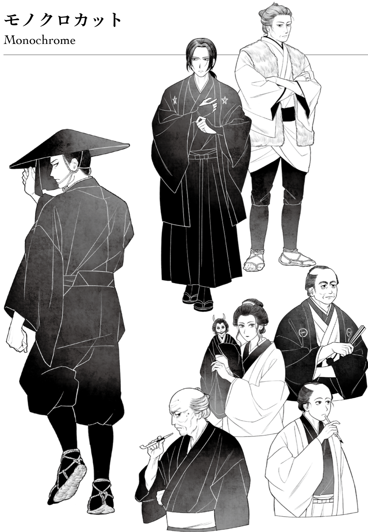
「怪と幽」vol.016 (KADOKAWA) 特集「京極夏彦「巷説百物語」了」内、『了巷説百物語』主要キャラクターイラスト