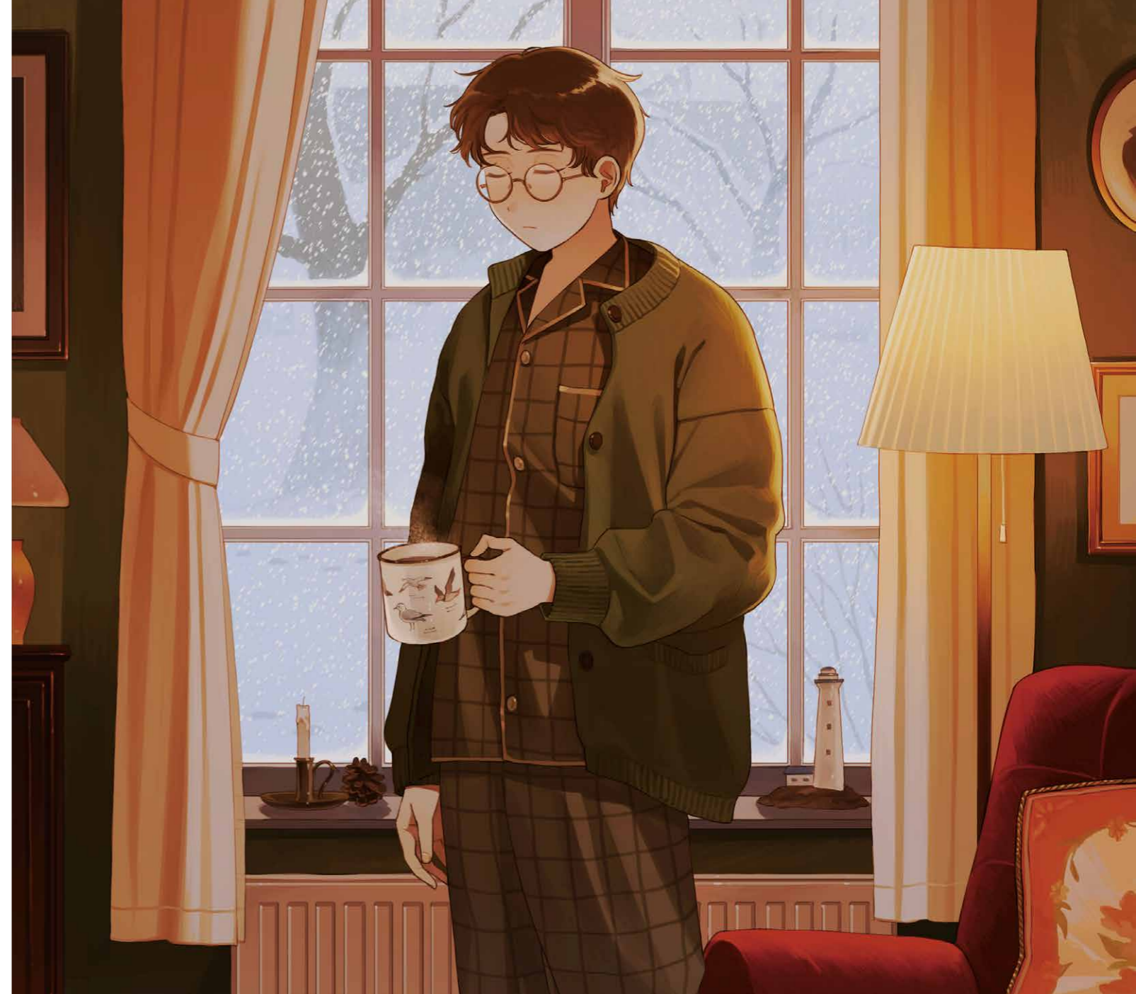
オリジナルイラスト (2024 年制作)