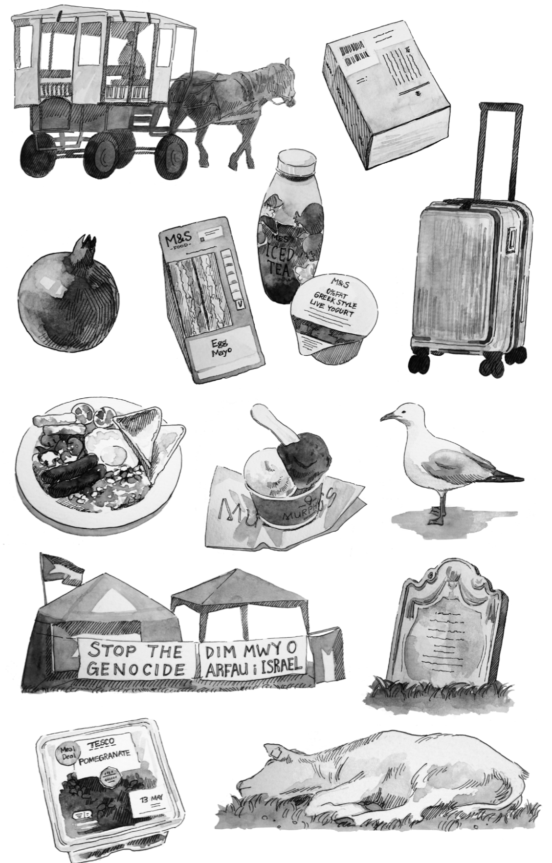
自主制作同人誌『イギリス・アイルランド一人旅日記』挿絵 ※アナログ（ミリペン、透明水彩）で制作後、デジタルで編集