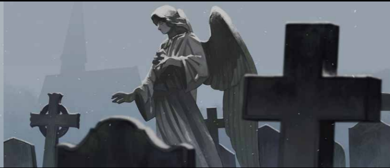
オリジナルイラスト 映画のワンシーンをイメージした連作 (2023年制作)