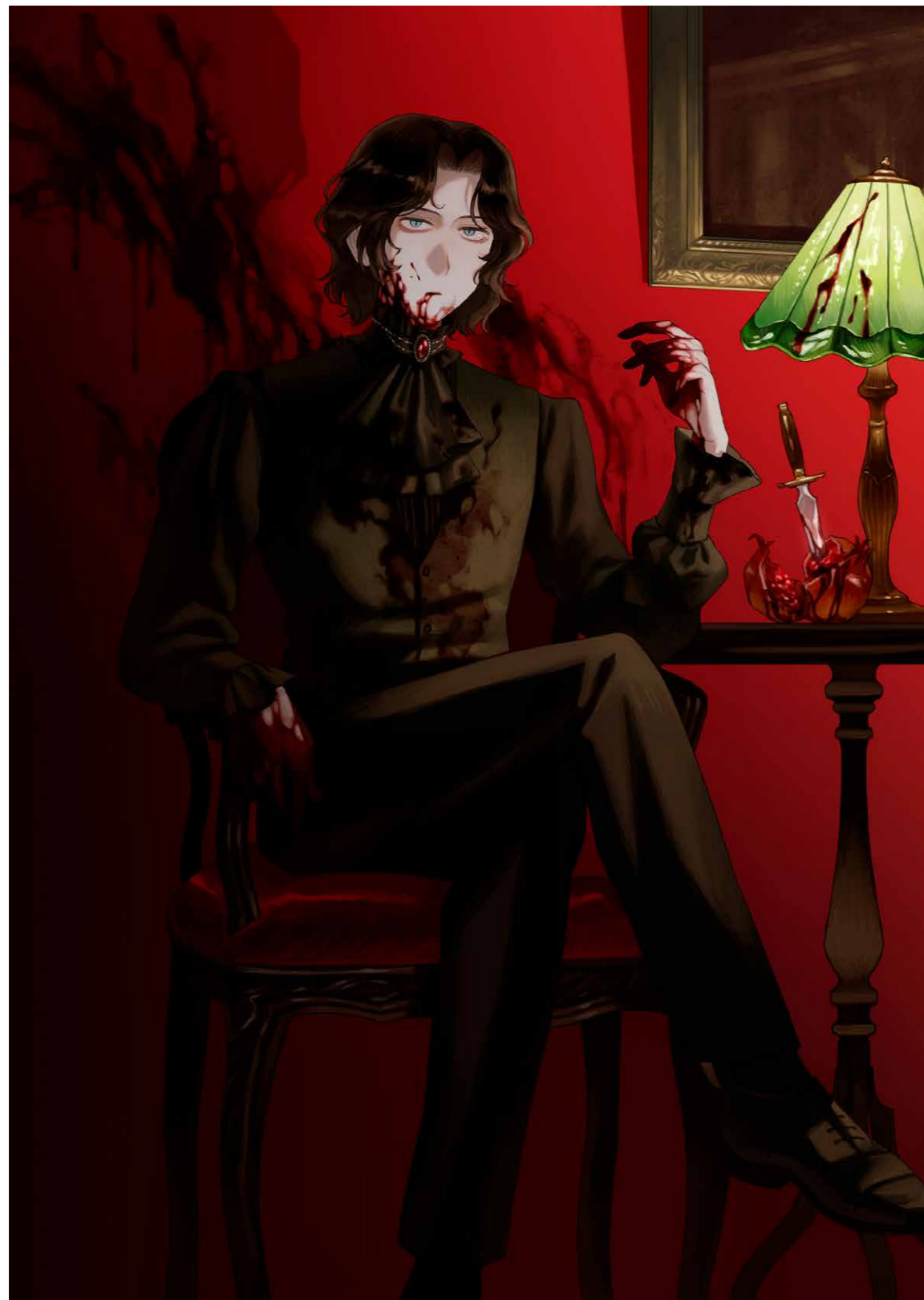
左頁 オリジナルイラスト (2025年制作)